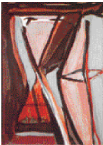
Bram Van Velde, sans titre 1978 estampe 77x55 cm - collection ville de Vénissieux

Connu pour son important Journal publié aux éditions P.O.L en plusieurs volumes « Quand j'ai commencé à (l') écrire, je ne soupçonnais rien des raisons qui m'y poussaient. Des années ont dû s'écouler pour que je comprenne ce qui m'obligeait à rédiger ces notes » , il est aussi l'auteur de recueils de poèmes et d'ouvrages retraçant les relations qu'il entretenait avec les écrivains et les artistes. Dès « ces années lentes » qui suivirent l'abandon de ses études à l'école de Santé militaire de Lyon, pour se consacrer à l'écriture « écrire c'était m'élucider » , il rencontre Michel Leiris, Pierre Soulages, Samuel Beckett, mais surtout Bram Van Velde, à qui il rend visite pour la première fois en 1964 et qu'il fréquentera régulièrement ensuite.